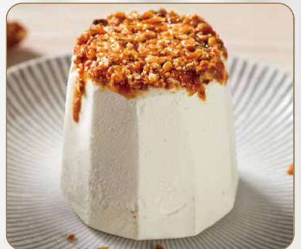
SEMIFREDDO TORRONCINO € 5.00