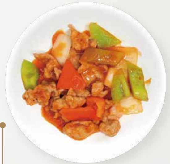
232 MANZO PICCANTE