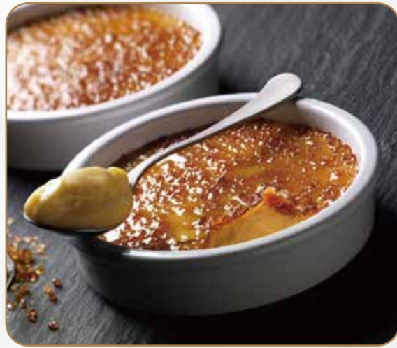
CREMA CATALANA € 5.50