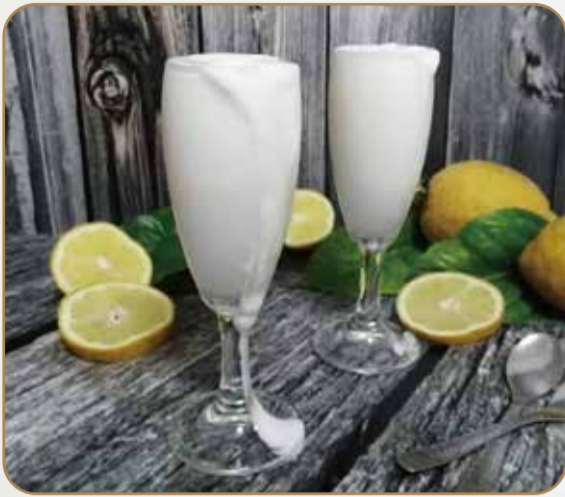
SORBETTO € 4.00