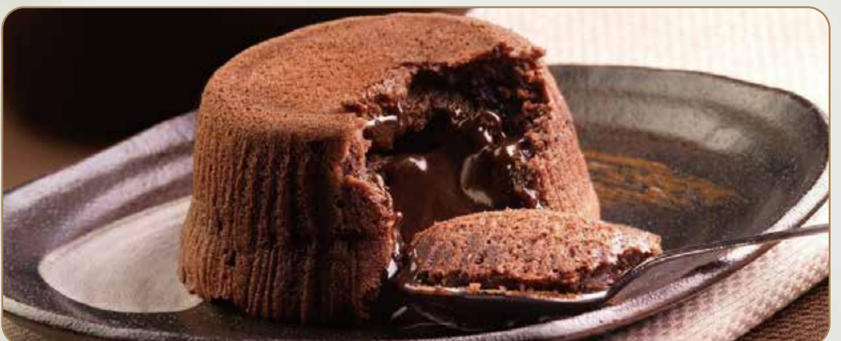
SOUFFLÉ AL CIOCCOLATO € 5.50