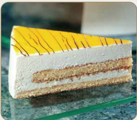
MOUSSE LIMONE € 5.00