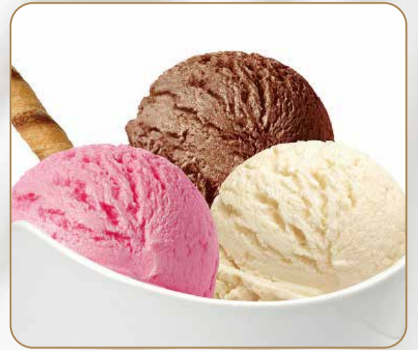
GELATO MISTO € 4.50