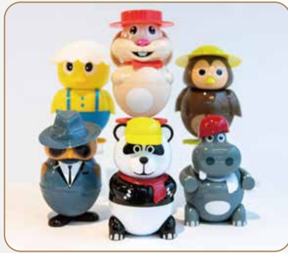
GELATO BIMBI € 4.00/PZ