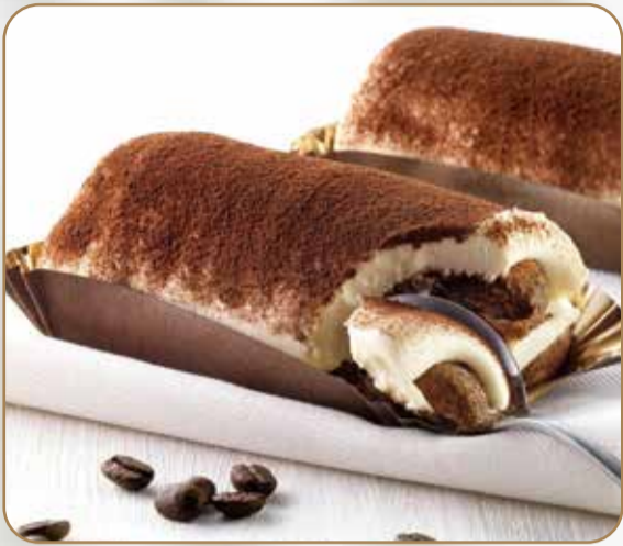
TIRAMISÙ € 5.00