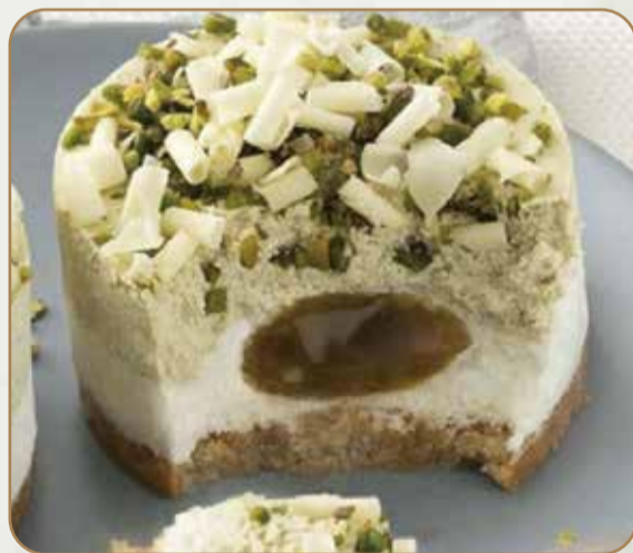
CREMOSO AL PISTACCHIO € 5.50