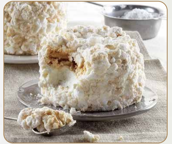
MERINGA € 5.00