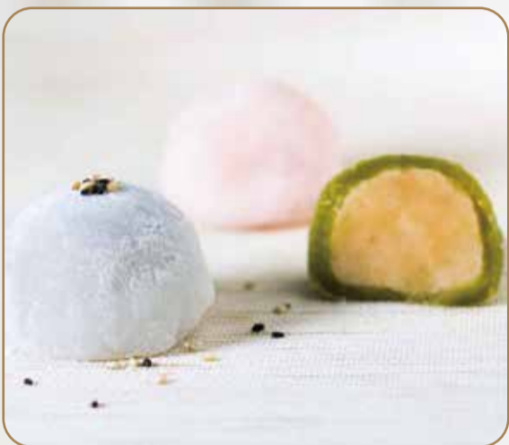
MOCHI € 5.00