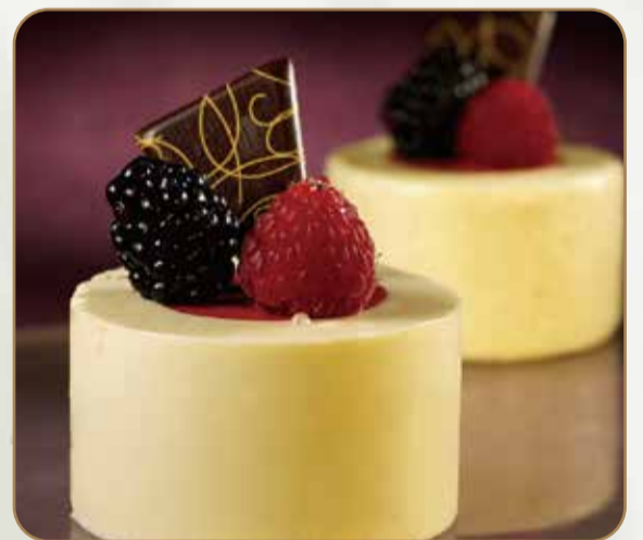
RONDO' VANIGLIA E FRAGOLA € 5.50