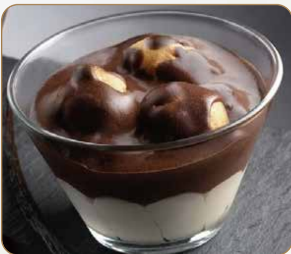
COPPA PROFITEROL € 5.50