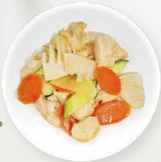
233 POLLO CON VERDURE