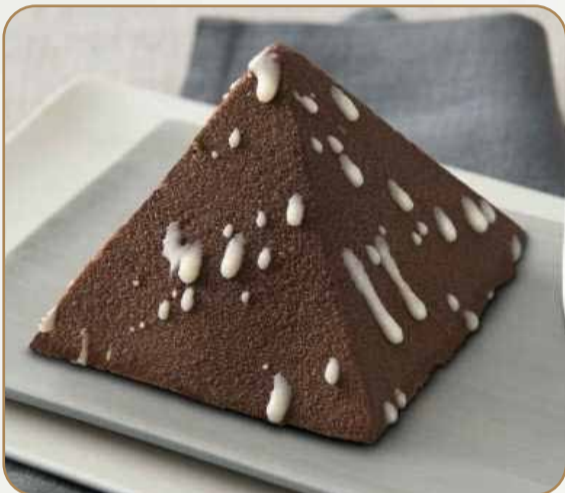
PIRAMIDE AL CIOCCOLATO € 5.00