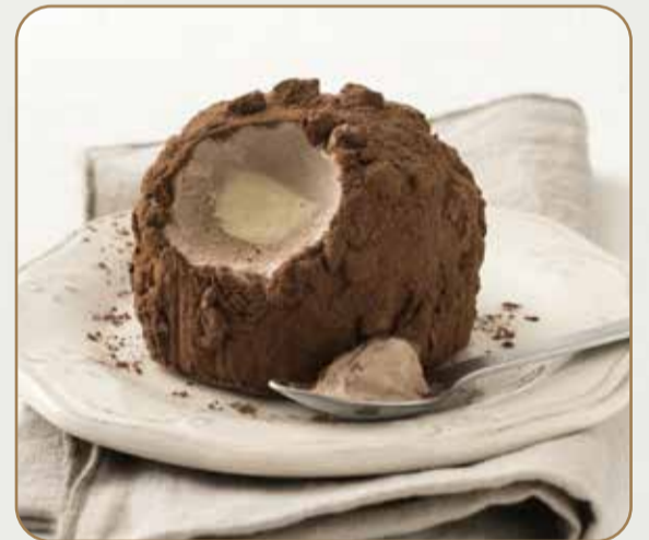
TARTUFO NERO € 5.00