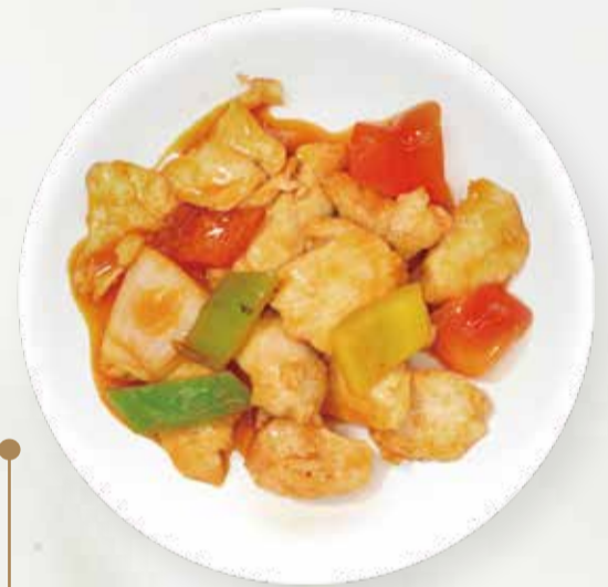
235 POLLO PICCANTE