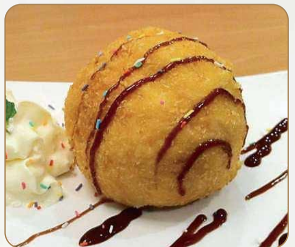
GELATO FRITTO € 4.60