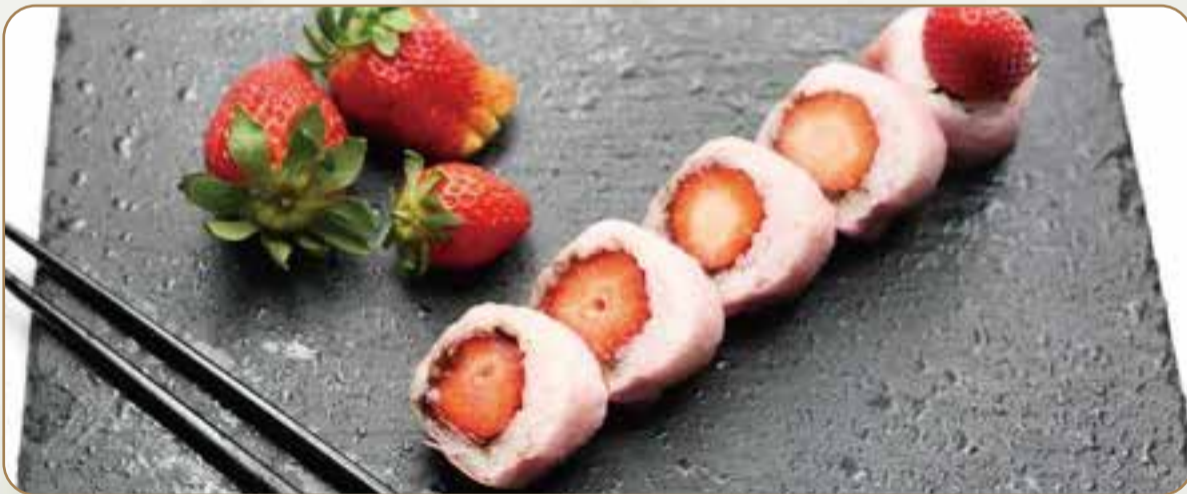
SUSHI STRAWBERRY € 5.00