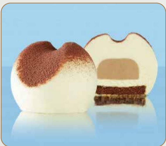
GOCCIA TIRAMISÙ € 5.50