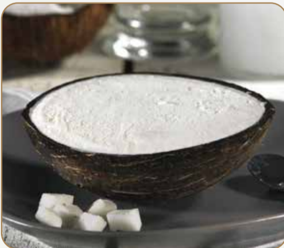
COCCO RIPIENO € 5.50