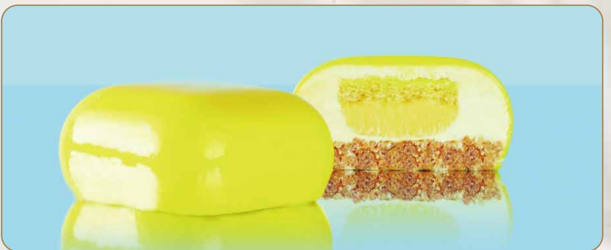
NONNA € 5.50