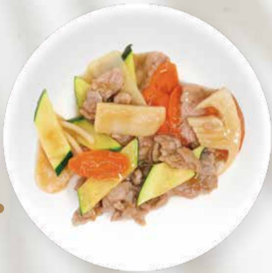
230 MANZO CON VERDURE